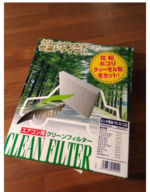
※当社で使用のエアコンフィルター